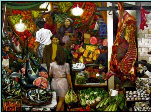
Renato Guttuso, La Vucceria (1974)