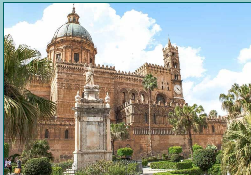
Cattedrale Primaziale della Santa Vergine Maria Assunta

Ordine delle Professioni Infermieristiche di Palermo